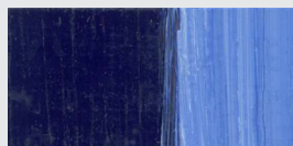
937 Ultramarin *** Ultramarine Outremer